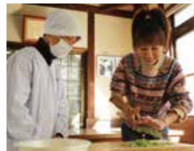
わさびの茎や根まですべて使用したわさび漬づくりを体験。

●場所/静岡市葵区有東木280-1 営業時間/ (3月~11月) 平日10:00-15:00 / 土日祝 9:00-16:00 (12月~2月) 平日10:00-14:30 / 土日祝 10:00-15:00 ☎054-298-2900