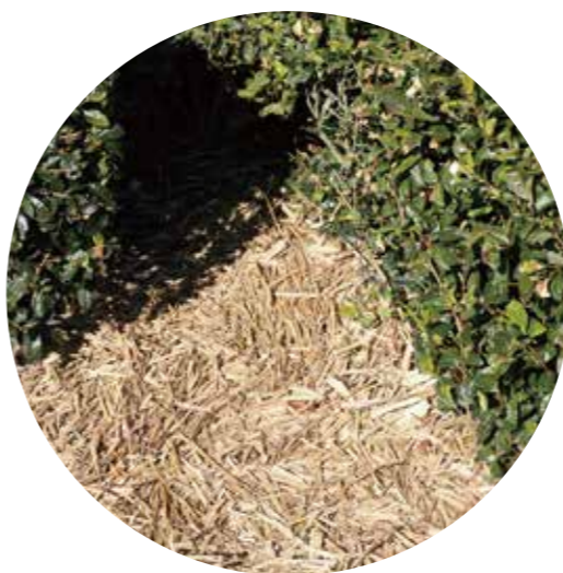
茶草場農法とは、茶園近くの草を刈り取り畝間に敷くことで土を肥やし、茶の品質向上につながる伝統的な農法。