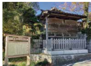
江戸時代中期に設置された下木戸の「高札場」を復元したものの。

茶草場農法による深蒸し茶づくりが今も続いている日坂。農家や企業、地域が連携し、日坂茶の文化と味を宿場町の賑わいととともに、次の世代へとつないでいる。