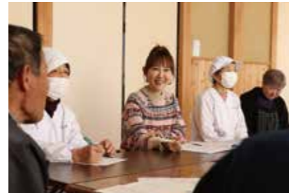
邑の代表者の想いや有東木の未来をめぐって率直な意見を交換しました。

スタッフの平均年齢は70歳近く。親子3代で支える家庭もあり、開店29年となる今も邑の宝であり続けています。