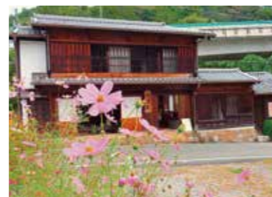
江戸時代の面影を残す数少ない旅籠「川版屋」。一般公開されている。